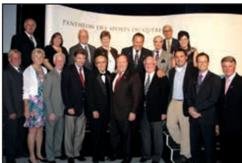
Membres du Temple de la renommée.