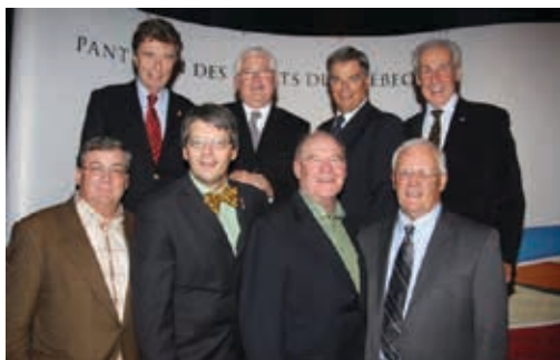
Des membres de notre comité de sélection.

Ainsi les portes de notre Temple sont ouvertes à tous les grands champions Québécois et à ceux qui ce sont illustrés au Québec, qu'il soit un receveur hors pair, un quart-arrière ayant dominé son époque ou une gymnaste ayant touché nos cœurs.