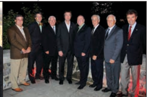
Membres du comité de sélection en compagnie de Patrick Roy