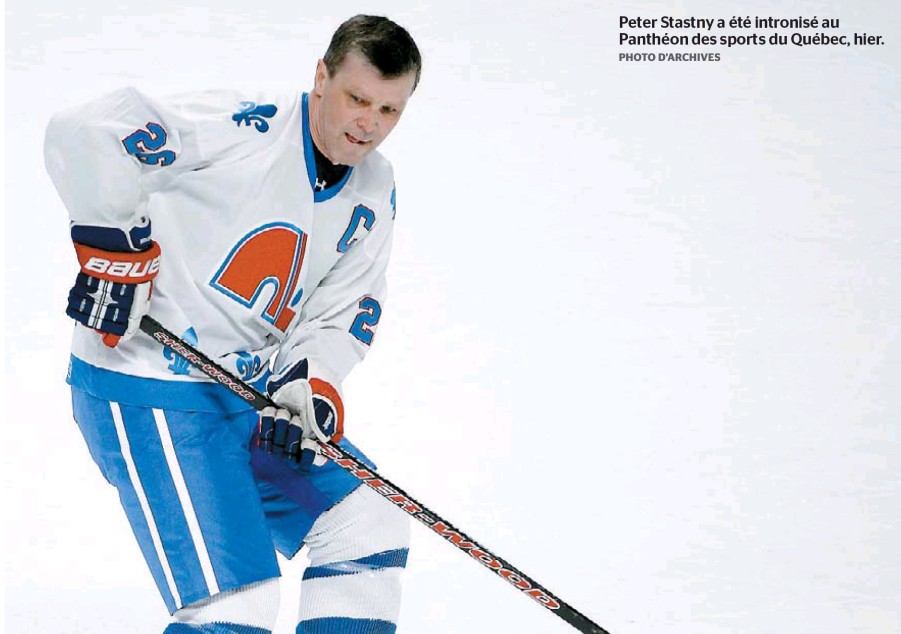
Peter Stastny a été intronisé au Panthéon des sports du Québec, hier.